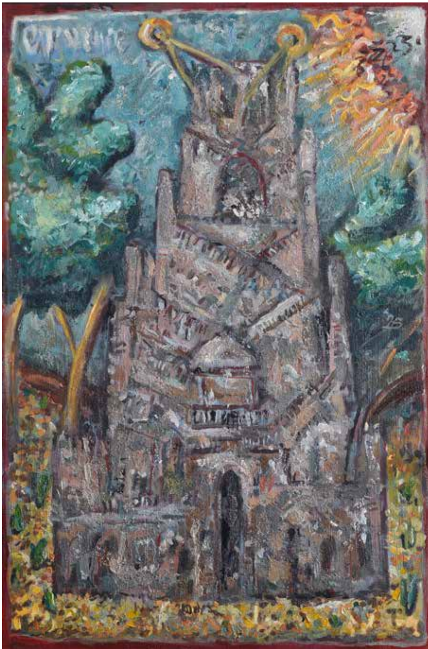
Зидање Вавилонске куле, (по Жефаровићу, манастир Бођани) комбинована техника на платну, 2019.