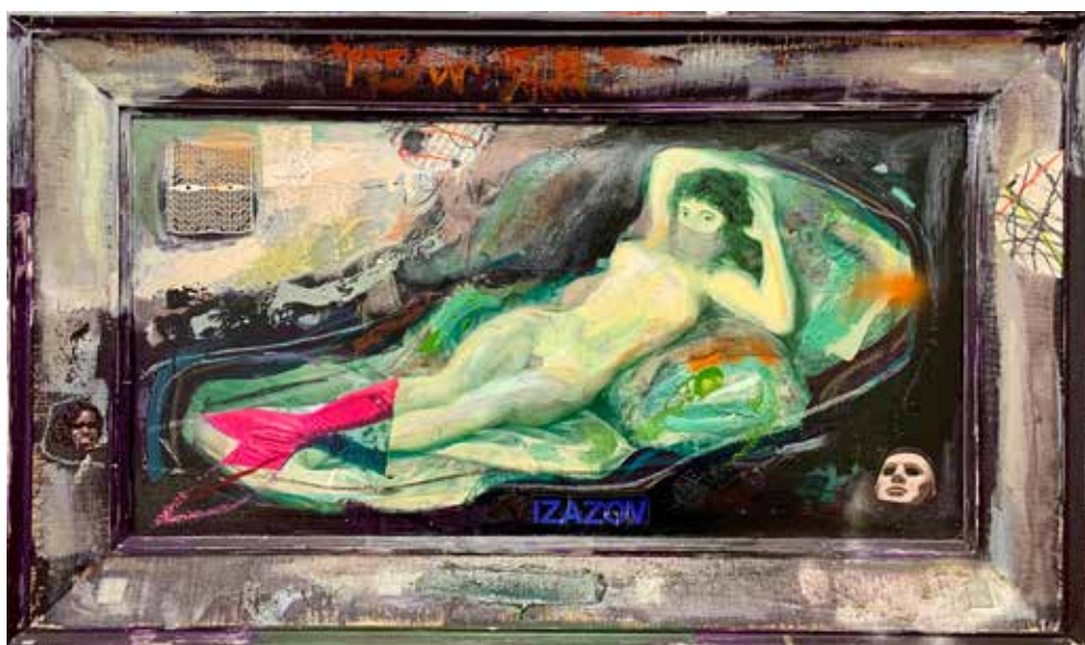
Из серије (М)алегорије (Изазов Наге Маје) комбинована техника на платну, 2019.