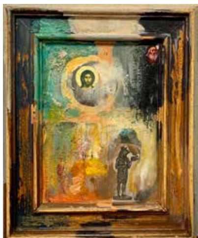
Из серије (М)алегорије (Христ, Хорус и Георгије Бранковић) комбинована техника на лесониту, 2019.