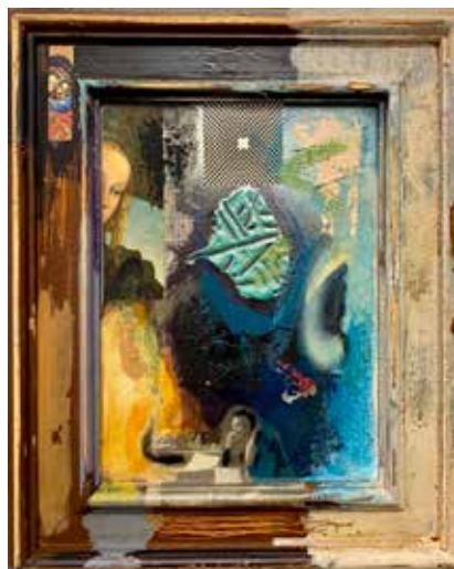
Из серије (М)алегорије, (Богородица и Лаза Костић) комбинована техника, 2019.