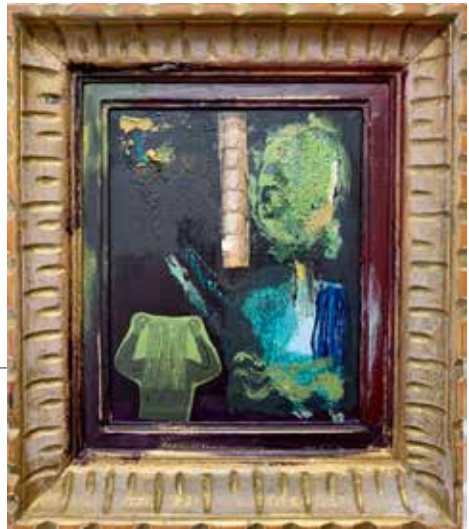
Из серије (М)алегорије (Дрво Живота) комбинована техника, 2019.