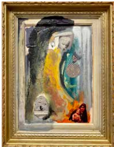
Из серије (М)алегорије (Гноза) комбинована техника, 2019.