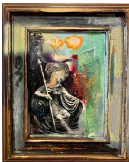
Из серије (М)алегорије (Чувар Светла) комбинована техника, 2019.