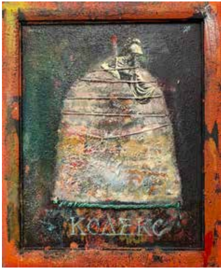
Из серије (М)алегорије (Атена Палада) комбинована техника, 2019.